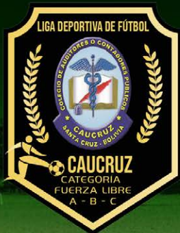
Tabla de Posiciones de la Liga Deportiva CAUCRUZ 2021 - Categoría Fuerza Libre A

COLEGIO DE AUDITORES O CONTADORES PÚBLICOS DE SANTA CRUZ - CAUCRUZ