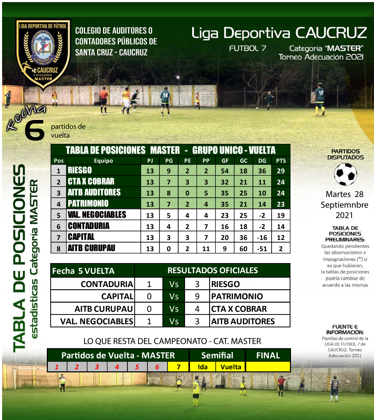
Tabla de Posiciones de la Liga Deportiva CAUCRUZ - Categoría MASTER Super Senior