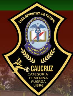
Tabla de Posiciones de la Liga Deportiva CAUCRUZ 2021 - Categoría Fuerza Libre DAMAS

COLEGIO DE AUDITORES O CONTADORES PÚBLICOS DE SANTA CRUZ - CAUCRUZ